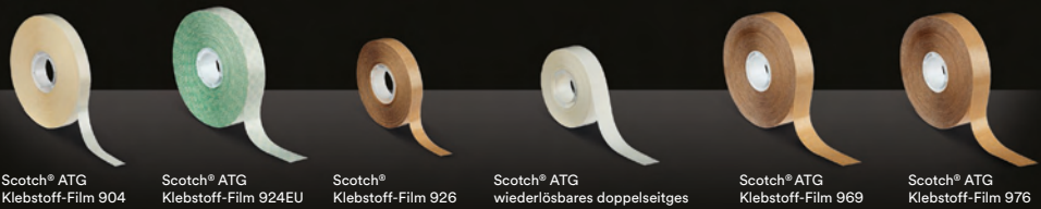
Scotch® ATG Klebstoff-Film 904